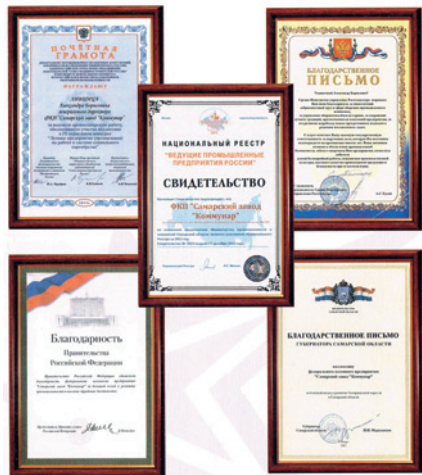
Награды ФКП «Самарский завод «Коммунар»

ФКП «Самарский завод «Коммунар» был основан в 1942 году. С момента основания и по настоящее время наш коллектив выполнял и продолжает выполнять самые сложные задачи как производственные, так и социального характера. Многолетний опыт, профессионализм сотрудников, преемственность поколений, высокая технологическая и исполнительская дисциплина обеспечивают стабильное качество нашей работы и продукции.