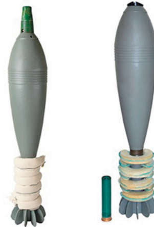
Заряд переменный метальный 54-Ж-843