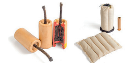
Взрывпакет имитационный 57-Х-762 Заряд переменный метальный 4-3-9